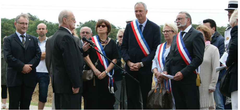
Commémoration de la bataille de 1870, le 16 août dernier, au Monument aux Morts de Mey