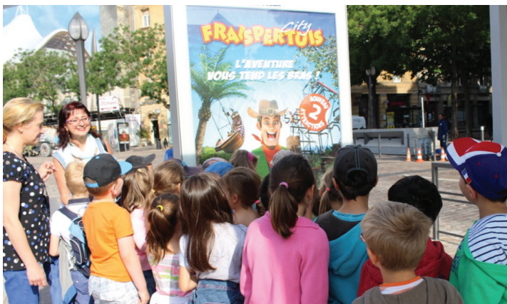
Sortie de fin d'année au parc d'attractions de FraisPERTUIS, dans les Vosges, pour les enfants de l'école Les Moulins