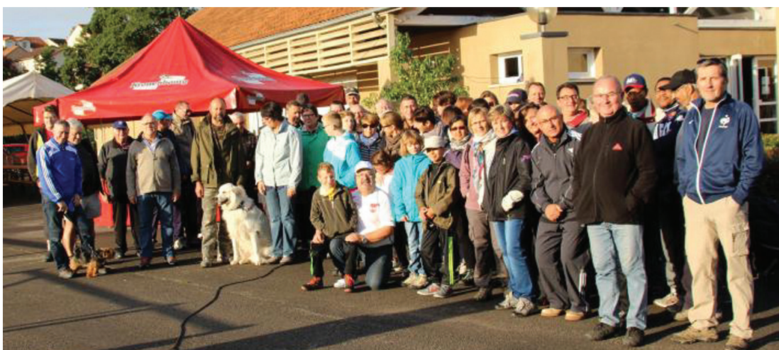
La toujours très attendue « journée cochon » organisée par l'association Vantoux Loisirs a connu un succès extraordinaire cette année. Elle a battu tous les records de participants : 75 marcheurs le matin, et 240 convives pour déguster les 6 cochons à la broche préparés par la très dynamique équipe de l'association. Bravo aux organisateurs !