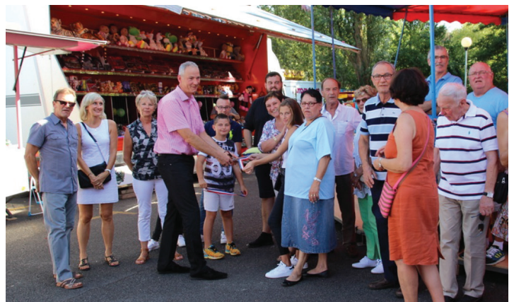
Joli succès pour la fête du village, organisée par la Lyre Sportive, et inaugurée sous un beau soleil par M. le Maire