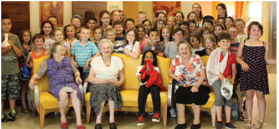
Petite visite très appréciée des enfants de l'école Les Moulins aux résidents de la maison Alice Sar