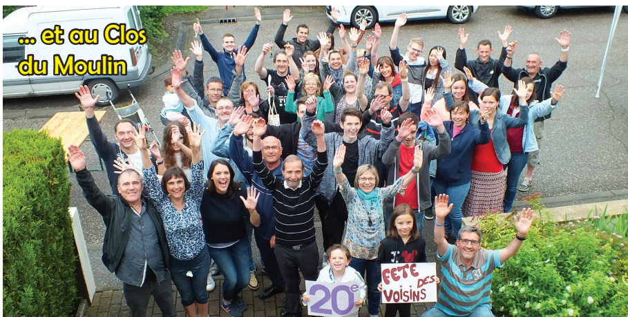
... et au Clos du Moulin

Des voisins de toutes générations ont fait la fête ensemble à la maison Alice Sar. Les résidents avaient convié les habitants du lotissement du Mi-Mangenot. Des plus jeunes aux plus âgés, tous ont passé un bien agréable moment