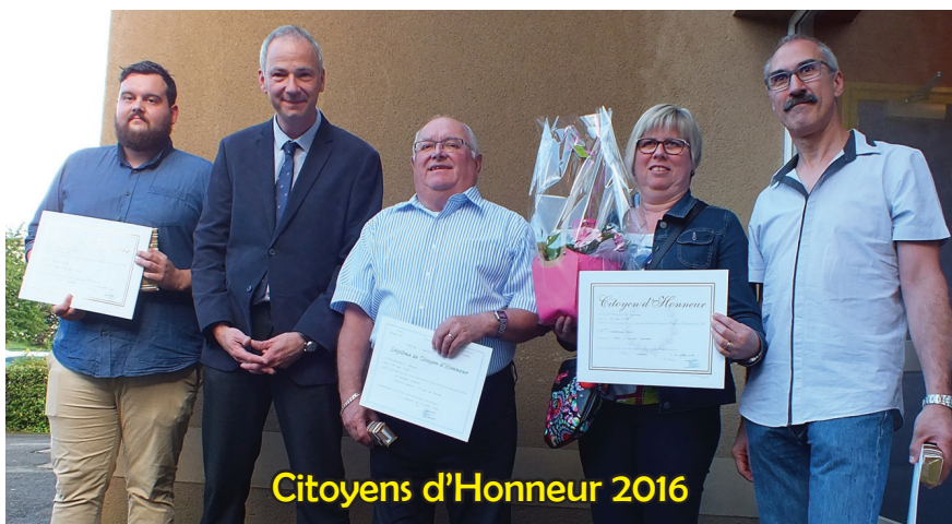
Citoyens d'Honneur 2016

Félicitations à toutes ces personnes dévouées qui font honneur à ce sympathique club de football.