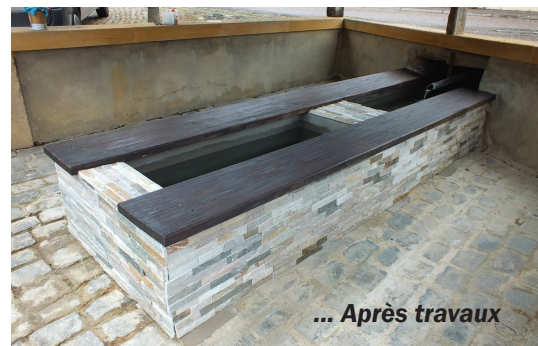
... Après travaux