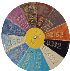
Le nuancier de couleurs référence les différentes teintes utilisables lors de l'émaillage