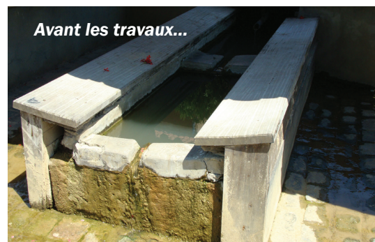
Avant les travaux...