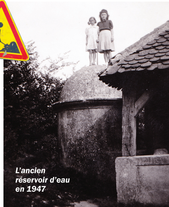
L'ancien réservoir d'eau en 1947