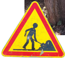
Fouilles au parc

Dans la continuité du PLU (Plan Local d'Urbanisme) de notre commune, le projet de construction dans la partie Nord du parc municipal progresse normalement. La première étape a consisté à réaliser les sondages géotechniques pour déterminer le type de fondations à réaliser. Après cette phase technique est intervenue la phase réglementaire avec les fouilles archéologiques préventives menées en novembre. Elles ont consisté à creuser des « fosses » d'environ 2 mètres de profondeur, réparties de manière régulières sur la future zone à urbaniser, pour une recherche de vestiges archéologiques. Après analyse des résultats, aucun vestige important n'a été découvert et ces fouilles ont été clôturées sans recherche complémentaire par la DRAC. Les fosses ont ensuite été rebouchées.