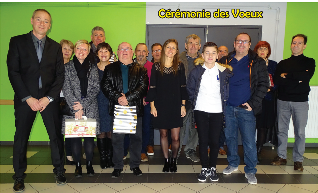
Cérémonie des Voeux