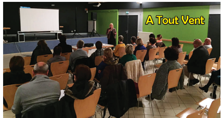
A Tout Vent