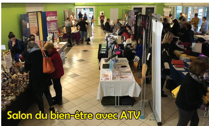
Salon du bien-être avec ATV

L'armistice de 1918 qui a mis provisoirement fin aux combats de la Première Guerre mondiale (1914-1918) a été signé le 11 novembre 1918. La cérémonie qui commémore cet événement historique s'est déroulée devant une foule de sympathisants au monument aux Morts du village, place Marcillac-la-Croisille.