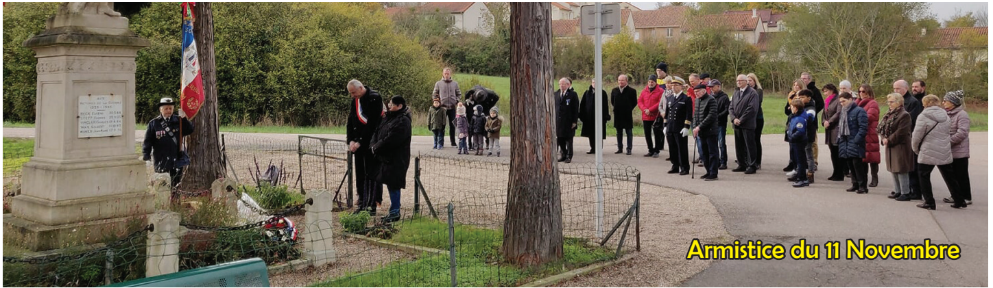
Armistice du 11 Novembre

L'armistice de 1918 qui a mis provisoirement fin aux combats de la Première Guerre mondiale (1914-1918) a été signé le 11 novembre 1918. La cérémonie qui commémore cet événement historique s'est déroulée devant une foule de sympathisants au monument aux Morts du village, place Marcillac-la-Croisille.