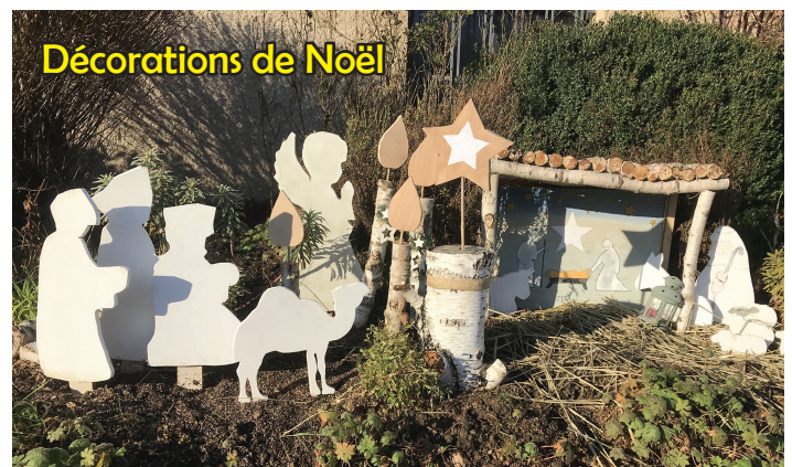
Décorations de Noël

Joli succès pour l'association A Tout Vent qui a organisé son premier salon du bien être en novembre dernier. Quelques 30 exposants ont ravi les personnes intéressées par tout ce qui tourne autour du bien-être et du mieux vivre.