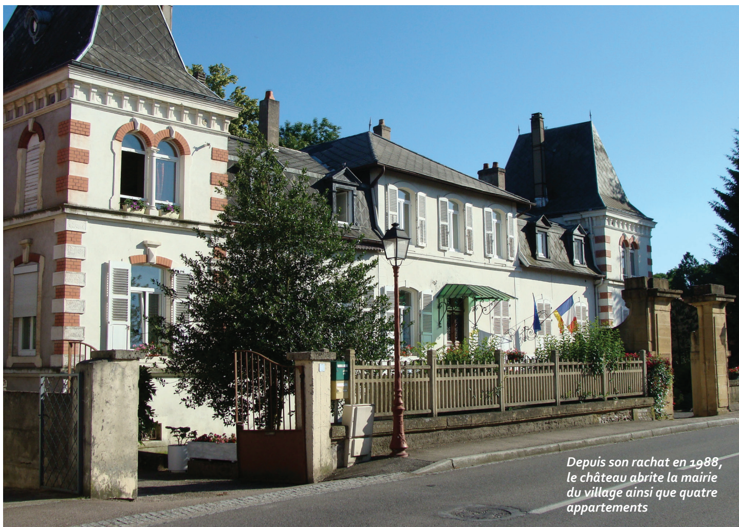
Depuis son rachat en 1988, le château abrite la mairie du village ainsi que quatre appartements