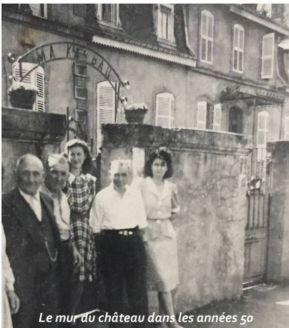
Le mur du château dans les années 50

Yvette Matte, qui habite les anciennes dépendances du château transformées en habitation se souvient : « Ma tante m'a raconté qu'à l'époque, le propriétaire du château se déplaçait dans une calèche tirée par un cheval. Elle était rangée dans un hangar aujourd'hui transformé en garage, en face de la mairie. Dans les dépendances du château, outre le cheval, on trouvait des vaches, des chèvres, des poules, des canards ainsi qu'une grande mare. Les box où étaient logés tous ces animaux existent toujours. On y trouvait aussi un grand atelier ainsi qu'un fourneau avec cheminée où les femmes faisaient la lessive. Egalement un pigeonnier du haut duquel les soldats allemands pouvaient surveiller la gare de Vantoux durant la dernière guerre. Dans le parc, un élégant bassin était alimenté par une des sources située à l'époque à l'emplacement de la maison Alice Sar ainsi qu'un ancien puits ».