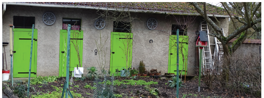
Les anciens box pour animaux du château existent toujours