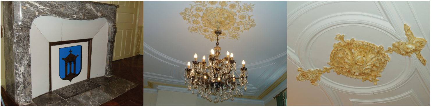
L'ancienne cheminée en marbre, les lustres et les plafonds moulurés... quelques vestiges de la décoration de la belle époque.