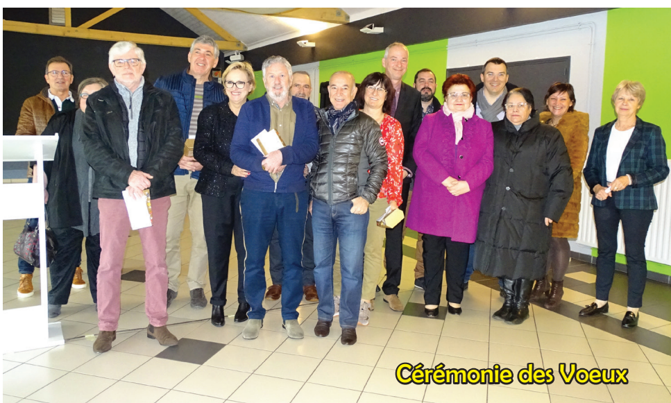
Cérémonie des Voeux