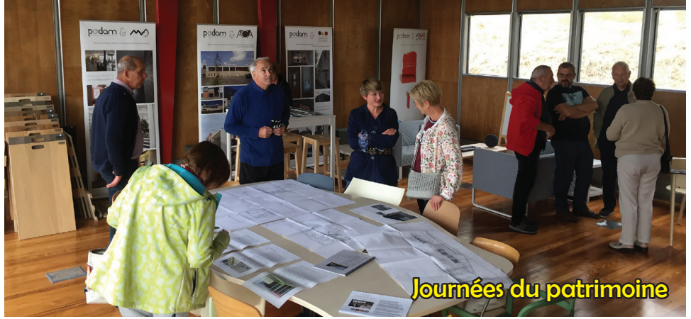
Journées du patrimoine

A l'occasion des journées européennes du patrimoine de septembre dernier, nombreux visiteurs ont eu l'occasion de visiter le bâtiment rénové de l'ancienne école construite par Jean Prouvé et son frère Henri en 1950, et dans laquelle s'est installée depuis plus d'un an les entreprises du PODAM (Pôle Design Architecture et Mobilier).