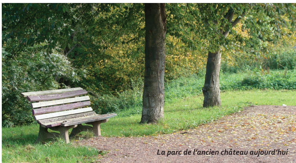
La parc de l'ancien château aujourd'hui

Depuis le 12 mai 1988, le château a été racheté par la municipalité à Mme Rohrbacher pour s'y installer au rez-de-chaussée, les locaux de l'ancienne mairie (aujourd'hui cabinet de kinésithérapie) étant devenus trop exigus, tant au niveau de l'accueil du public que de l'archivage des documents administratifs. Ce qui permet aussi à la commune de conserver ce patrimoine architectural. Afin de faciliter l'accès des véhicules dans l'enceinte du château, le sens du porche d'entrée en pierre de Jaumont a été inversé. Quatre appartements, deux dans l'aile gauche et deux dans l'aile droite ont été réhabilités et sont loués par la municipalité.